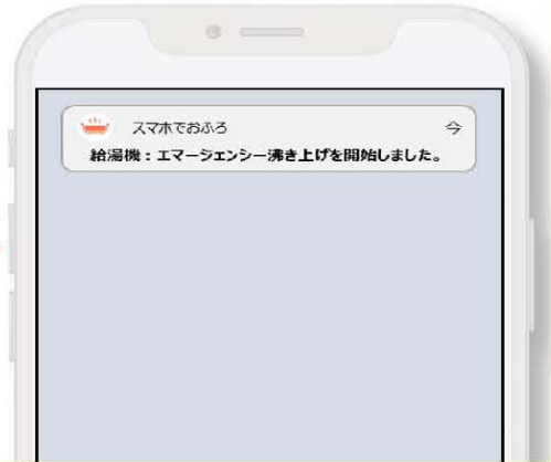
自動で全量沸き上げがスタート 警報・注意報解除後、自動停止