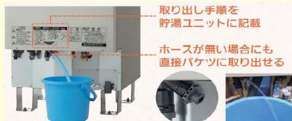
取り出し手順を貯湯ユニットに記載 ホースが無い場合にも直接バケツに取り出せる ※熱いお湯にご注意ください。 非常時にも排水コックからお湯の取り出しが可能

【詳しい情報はこちら】 https://news.panasonic.com/jp/press/data/2020/08/jn200804-2/jn200804-2.html