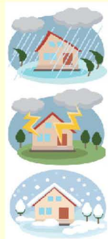
該当する警報・注意報が発令