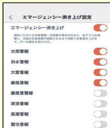
「エマージェンシー沸き上げ」を行う災害警報・注意報を設定

※3：2013年6月以降発売の角型モデル370 L・460 L貯湯ユニットにおいて 試験条件：JMA神戸液120%にて加振