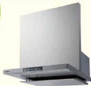
この写真は FY-60DE03-S です。扉板は別売です。 写真は本体と別売の扉板を組み合わせたものです。